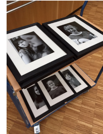
Fotografie – Portraitworkshop

Mehr Informationen unter: www.in-die-fluten.de/design