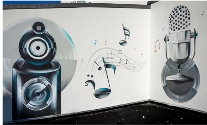
Fassadengestaltung – Dickmann / TV + Hifi Studio, Magdeburg