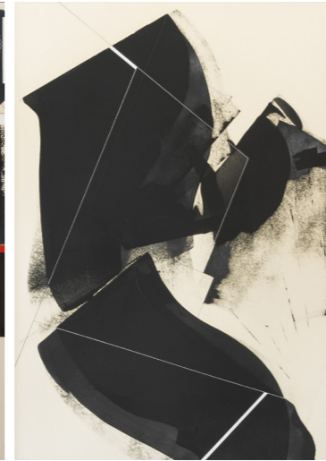
Circumstances and Distances - Linolfarbe u. Acryl . 100x70cm