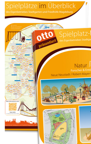
Lageplan u. Poster – Gestaltung, LHS Magdeburg