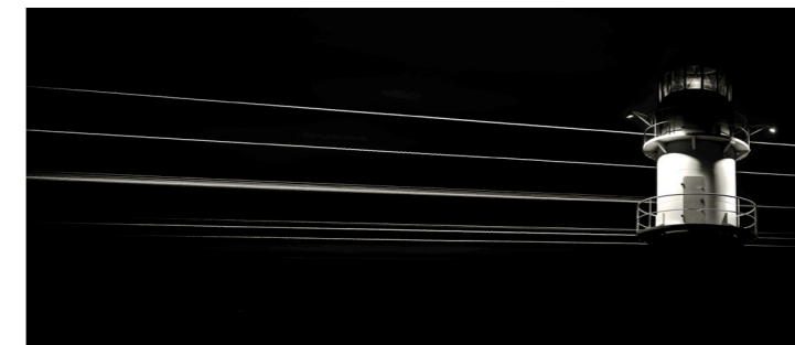
Leuchtturm - Warnemünde, Deutschland

Dipl. Designer, freischaffender Künstler