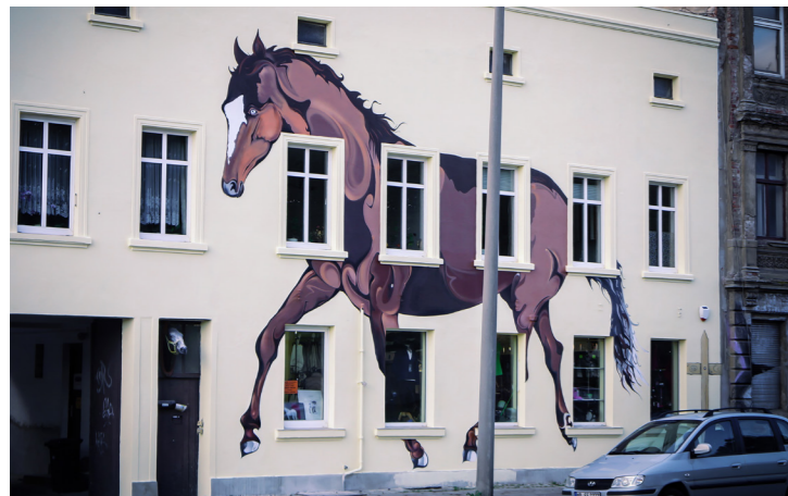
Fassadengestaltung – Sattlerei Hase, Magdeburg