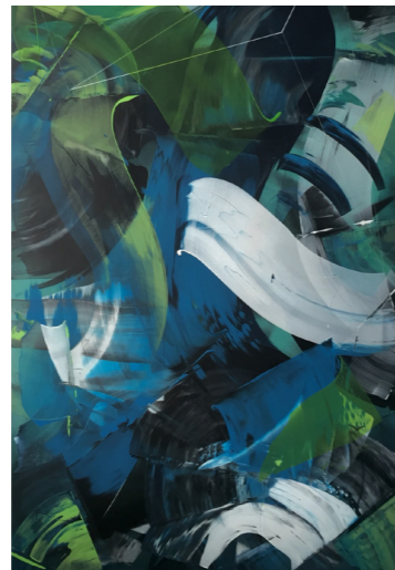
Abstract calligraphy - Acryl . 200x120cm