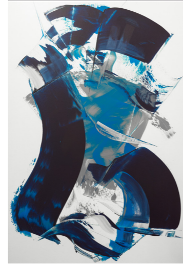
The Blue - Acryl . 100x70cm