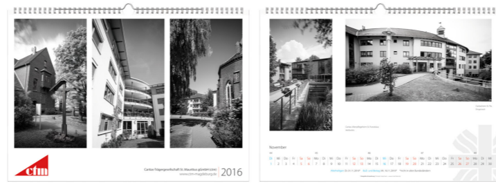
Wandkalender – Architektur fotografie und Gestaltung, Caritas Trägergesellschaft St. Mauritius gGmbH

Mehr Informationen unter: www.in-die-fluten.de/auftragsarbeiten