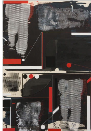
Blackbox - Acryl . 100x70cm

Urbanpiraten – Start Up - Magdeburg 2008