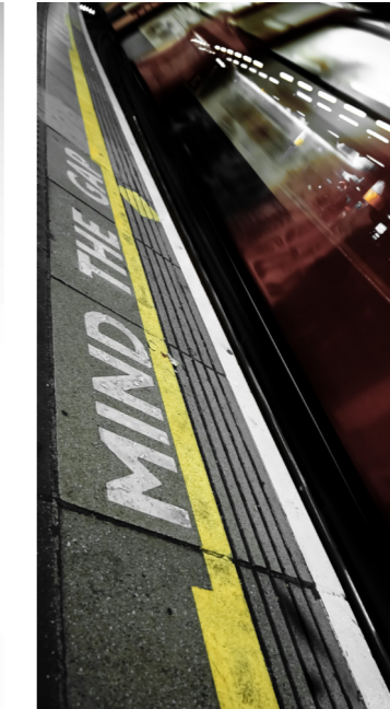
Metro / Mind the Gap - London, Großbritannien