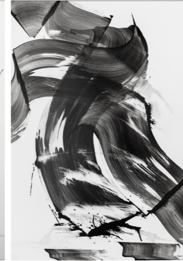
Raw - Antiktusche . 100x70cm