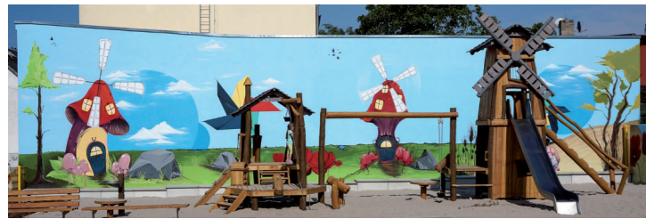
Fassadengestaltung – Spielplatz / Mühlenwiese, Magdeburg