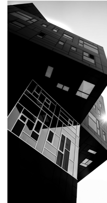
University of Economics - Wien, Österreich