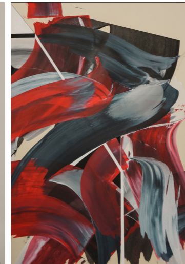
Satisfaction - Acryl . 100x70cm

„Ich bin für eine Kunst, die etwas anderes tut, als auf ihrem Arsch im Museum zu sitzen. Ich bin für eine Kunst, die entsteht, ohne zu wissen, daß sie überhaupt Kunst ist, eine Kunst, die die Chance erhält, beim Nullpunkt zu beginnen. [...] Ich bin für eine Kunst, die sich selbst in den alltäglichen Unsinn verwickelt und doch an seiner Spitze steht [...] Ich bin für eine Kunst, die ihre Form direkt aus dem Leben bezieht“