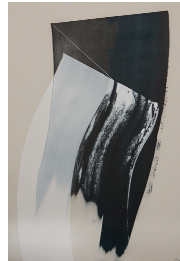
Fading Away - Acryl . 100x70cm