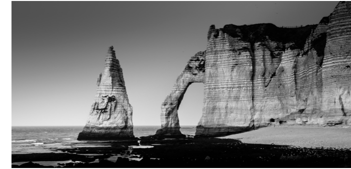
Falaises d'Aval / Étretat - Normandie, Frankreich

Der Kunstblitz – Magazin für Kunst u. Kultur - Jun. 2017